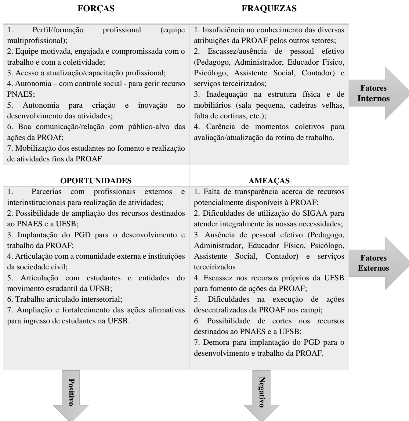
Figura 2. Análise SWOT PROAF

Com o objetivo de avaliar as potencialidades e dificuldades no trabalho desenvolvido pela PROAF realizou-se diagnóstico da unidade através da matriz SWOT. Esse instrumento permitiu a análise do ambiente interno e externo e elucidou nossas forças e oportunidades, bem como as fraquezas e ameaças. O diagnóstico foi construído coletivamente por toda equipe e forneceu um panorama geral dos fatores que podem contribuir ou dificultar o trabalho realizado pela Pró-Reitoria.