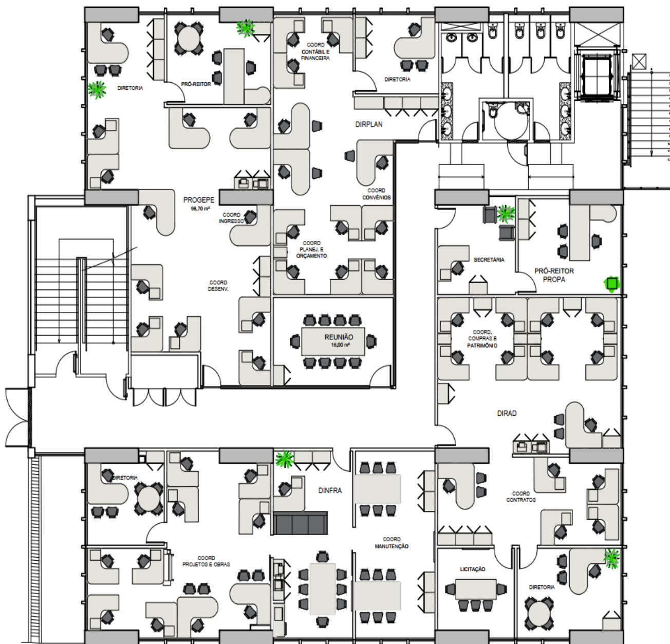
Figura 2 - Planta da Reitoria, pavimento 03, unidades alocadas PROPA e PROGEPE.

A Diretoria de Planejamento encontra-se no pavimento 03, fazendo parte da Pró Reitoria de Planejamento e administração (PROPA), conforme figura abaixo: