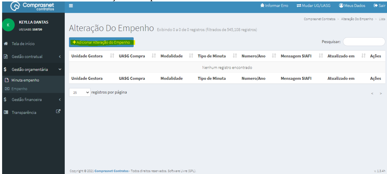
Figura 3: Alteração de empenho

3ºClicar em Adicionar alteração de empenho: