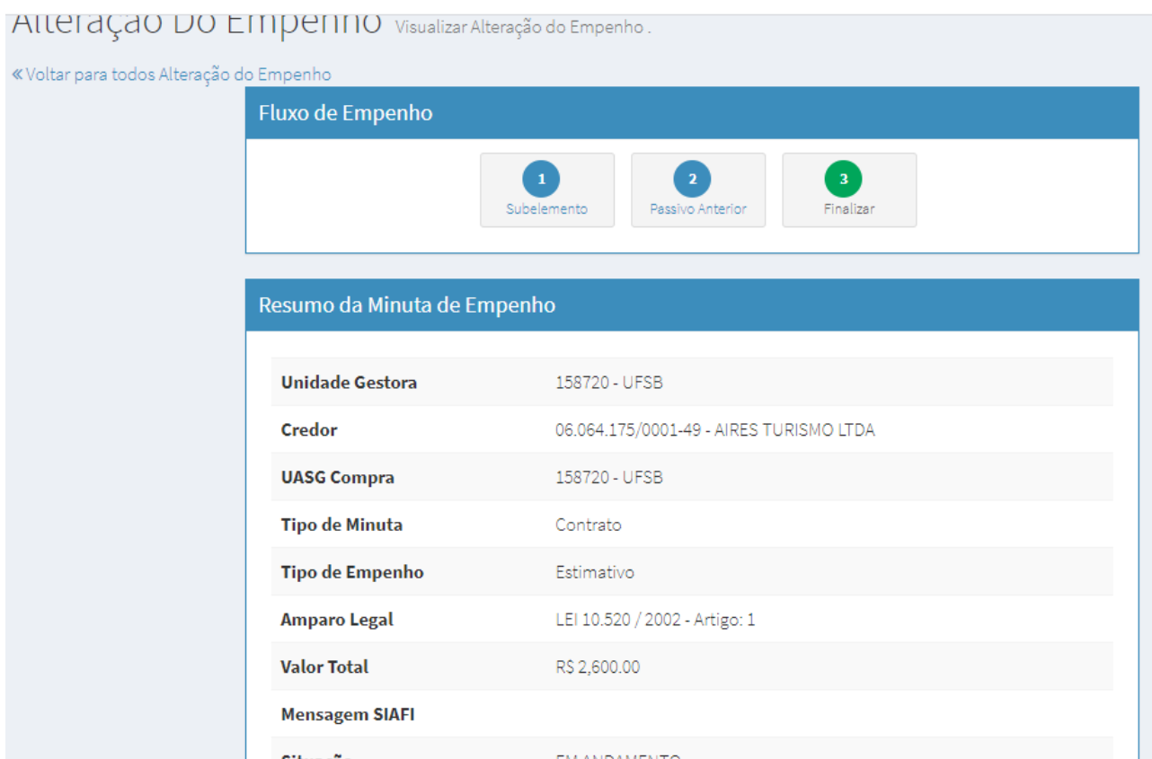
Figura 6: Conferência da minuta

7º Clicar em Emitir empenho SIAFI e depois em Finalizar: