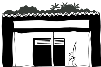
Casa da Capoeira de Ilhéus