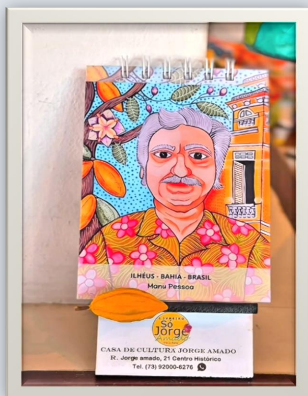
Exposição na Casa de Cultura Jorge Amado