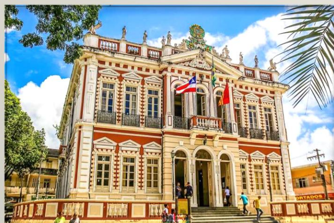
Museu da Capitania de Ilhéus