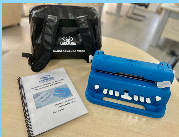
Máquina de escrever em braille