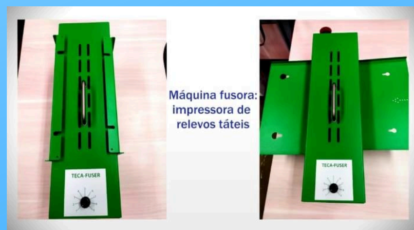
Máquina fusora/ Impressora de relevos táteis

Outros bens: cadeira de rodas, mesas adaptadas, scanner com voz, bengalas, teclados ampliados e em braille, lupa eletrônica e software DOVOX.