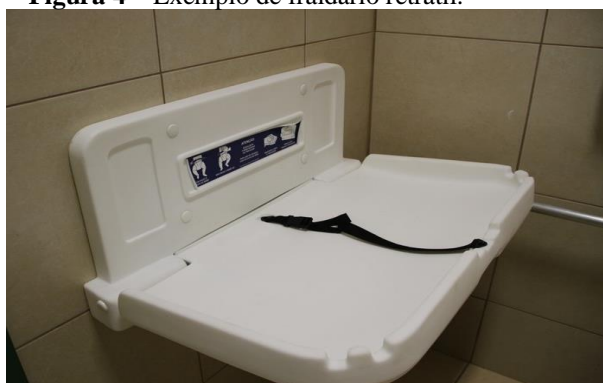
Figura 4 – Exemplo de fraldário retrátil.