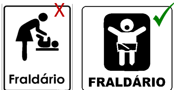
Figura 6 – Símbolos representativos para identificação de fraldários.