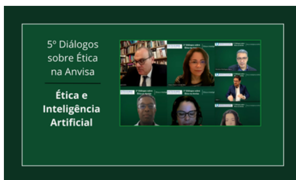
Conselheiro da CEP participa de debate sobre ética e inteligência artificial