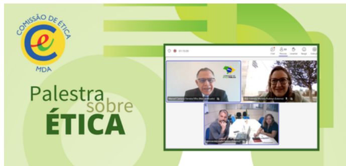
Presidente da CEP aborda importância da ética no serviço público em evento do MDA