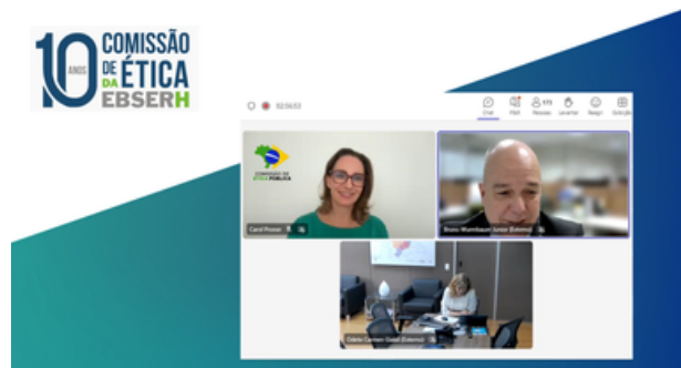
Conselheira da CEP apresenta palestra para empregados da Ebserh