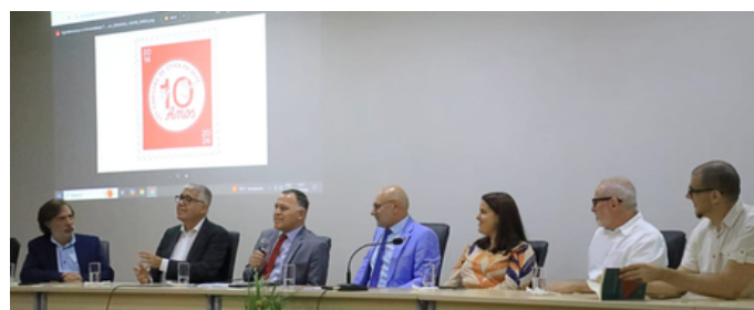
Presidente da CEP participa de mesa de honra na comemoração dos dez anos da Comissão de Ética da UFPE