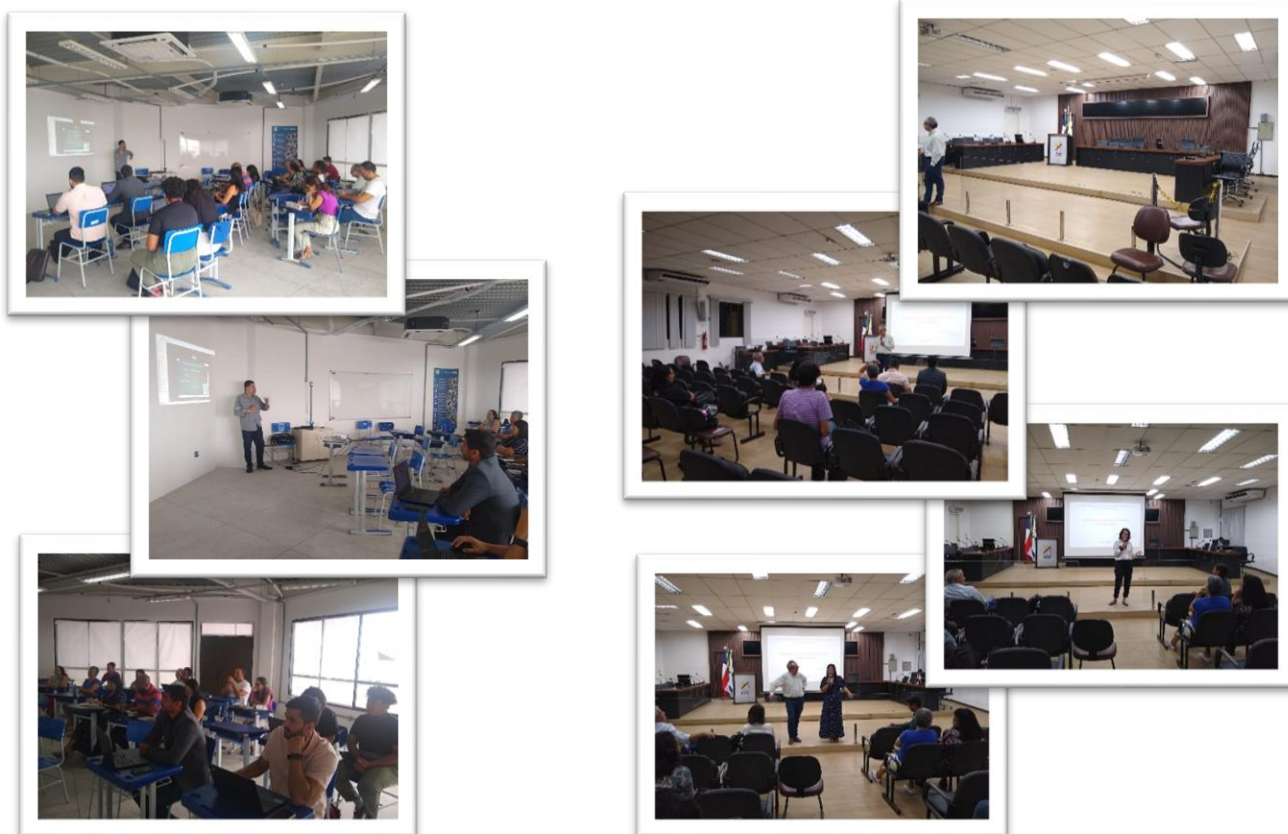
Campus Paulo Freire

No primeiro dia o evento foi realizado no período da manhã no Campus Paulo Freire, na cidade de Teixeira de Freitas, aberto a toda comunidade e foi divulgado nas rádios locais. No mesmo dia, no período da tarde o evento foi realizado na Câmara de Vereadores, aberto a sociedade e a comunidade da UFSB.