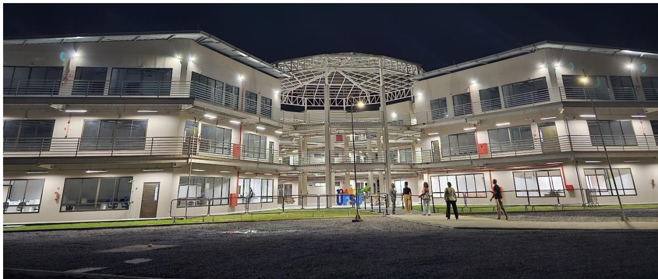
Figura 1 - Núcleo Pedagógico do Campus Paulo Freire na área do Complexo II, inaugurado em 2024.

começaram em fevereiro de 2025, com finalização prevista para 2027.